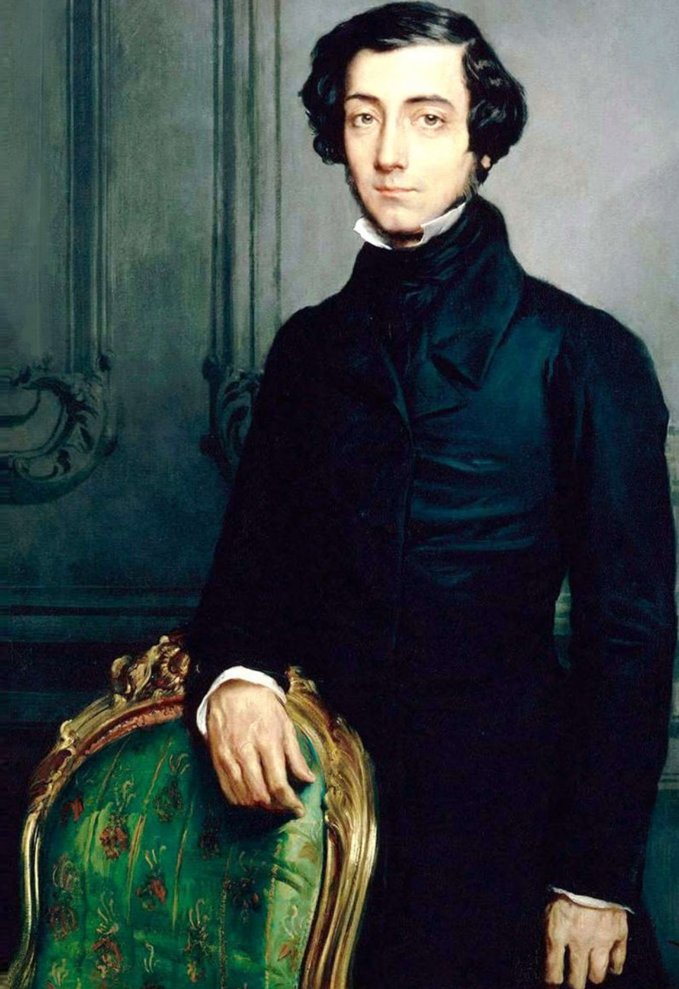
Alexis de Tocqueville, olie op doek, 1840.